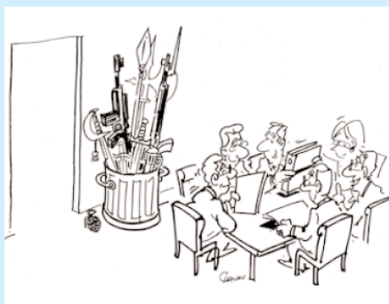
Faire preuve de méthode dans la négociation

L'Assemblée générale de la FNCL s'est tenue à Paris les 16 et 17 avril 2008.