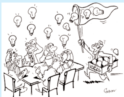
Valoriser l'expertise des sociétaires