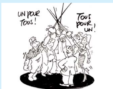
Favoriser l'affectio societatis, la transparence et la communication